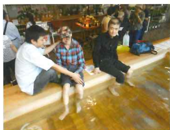
足湯に入りました