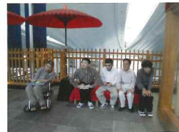
アクアライン海ほたる