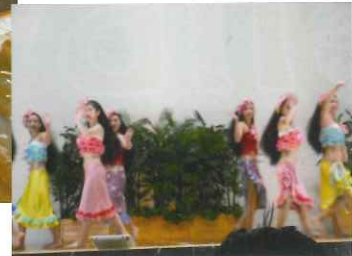
フラダンスショー見学