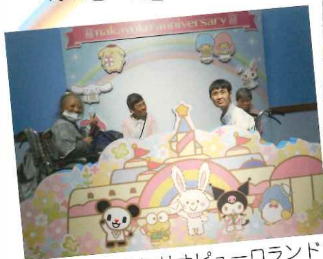
サンリオピューロランド