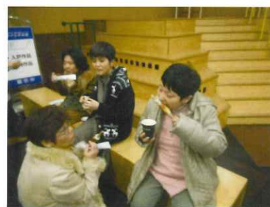
鈴廣かまぼこ工場でちくわの手づくり体験も……。